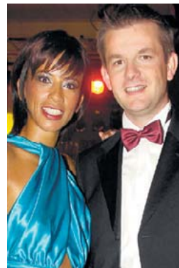
Glanzvolle Moderation: Arabella Kiesbauer und Rainer Maria Salzgeber.